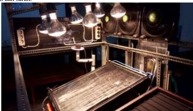
Gambar 1.1 Alat destilasi air Absorber kain perpendingin spray

Terdapat 3 variasi pengambilan data, yaitu : variasi pertama, dengan menggunakan volume air 600 mL, variasi kedua dengan menggunakan volume air 1000 mL, dan variasi ketiga dengan menggunakan volume air 1300mL. Dari variasi tersebut, kemudian akan dibandingkan antara variasi 1 dengan 2 dan variasi 1 dan 3. Pengambilan data dilakukan selama 2 hari dan pada 1 hari dengan selang waktu 6 jam untuk menurunkan temperatur absorber dan kaca. Pencatatan data dilakukan dengan sensor yang diatur dengan mikrokontroler, sehingga dapat dilakukan pengambilan data tiap menit. Setelah pengumpulan data dan analisis data selesai, penelitian dilanjutkan dengan penyusunan hasil data serta melakukan pengolahan, penarikan kesimpulan dan saran.