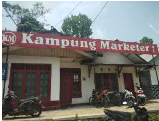
Gambar 1. Salah satu tempat pemberdayaan pada Kampung Marketer

pengetahuan yang nantinya diharapkan dapat meningkatkan strategi dan pencapaian visi dan misi yang dimiliki oleh Kampung Marketer.