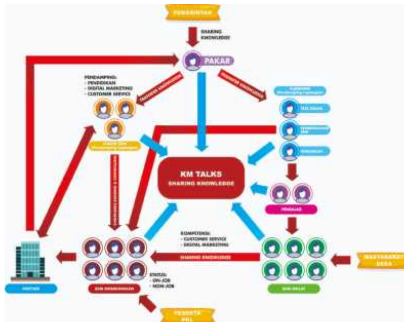
Gambar 3. Rich-picture situasi pada Kampung Marketer

Proses selanjutnya dari tahapan analisis ini adalah membuat gambaran visual terkait situasi yang terjadi pada Kampung Marketer terkait alur pengetahuan dalam bentuk rich-picture yang dibuat dalam Gambar 3, dengan menggambarkan semua entitas/actor yang terdapat pada Kampung Marketer beserta alur pengetahuan yang saat ini berjalan pada Kampung Marketer.