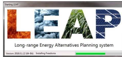
Gambar 1. Tampilan Perangkat Lunak LEAP