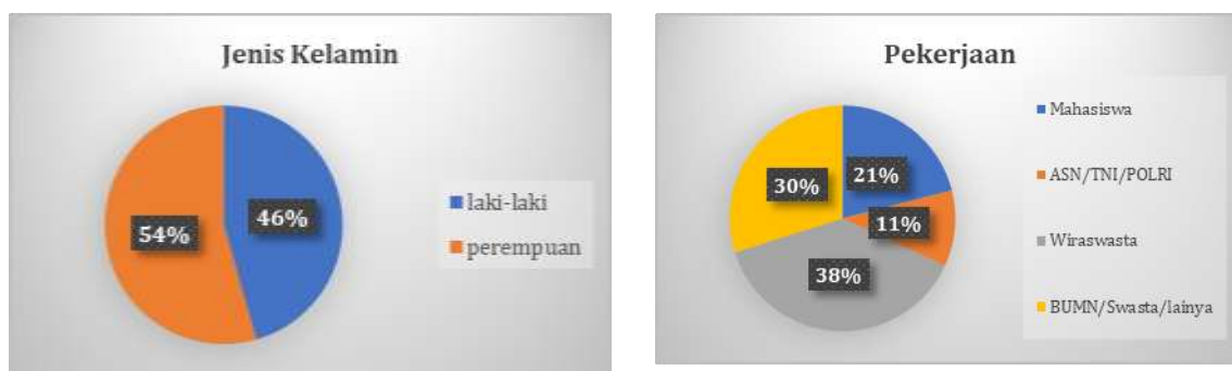
Gambar 2. Jenis Kelamin dan Pekerjaan responden

Sebelum menghitung jasa ekosistem rekreasi, maka dilakukan karakterisasi responden. Dalam penelitian ini responden ditentukan melalui metode simpel random sampling menggunakan kuesioner yang disebar kepada masyarakat melalui survei lapangan. Kriteria responden adalah masyarakat yang tinggal di wilayah Daerah Istimewa Yogyakarta baik penduduk asli DIY maupun penduduk pendatang dengan lama tinggal kurang dari 5 tahun. Dapat diasumsikan bahwa kebanyakan merupakan mahasiswa yang sedang menempuh pendidikan di Yogyakarta. Terdapat 222 orang atau 56,2% penduduk asli Yogyakarta dan 173 orang atau 43,8% penduduk luar Yogyakarta. Selain itu terdapat beberapa karakteristik yang menggambarkan populasi antara lain jenis kelamin, pekerjaan, pendidikan, dan jumlah kunjungan dari Embung Julantoro.