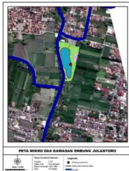
Gambar 1. Mikro DAS Kawasan Embung Julantoro

Dalam penelitian ini, Jasa ekosistem budidaya perikanan khususnya budidaya perikanan air tawar dimasukkan dalam penilaian dari Embung Julantoro. Pendekatan yang digunakan dalam penilaian ini yaitu menghitung surplus produksi komoditas ikan (16) dengan membuat batasan daerah aliran sungai secara mikro (mikro das) dibawah ketinggian dari lokasi Embung Julantoro sendiri. Dengan menggunakan batasan mikrodas ini, kemudian dilakukan deliniasi lokasi-lokasi kolam budidaya perikanan menggunakan citra satelit yang diperoleh dari google earth .