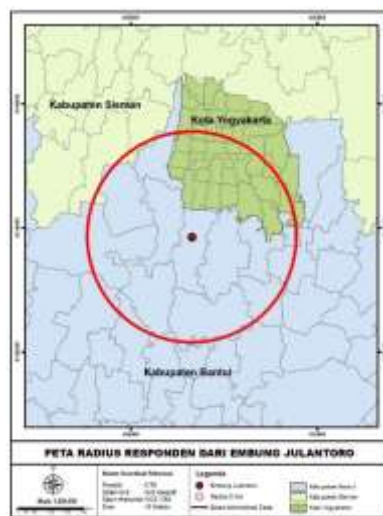
Gambar 5. Radius tempat tinggal responden

Berdasarkan tabel 2 diatas, diketahui bahwa nilai mean WTP berdasar pengolahan kuesioner sebesar Rp. 7.721,52- mengindikasikan kesanggupan responden untuk membayar retribusi masuk ke Embung Julantoro sebesar Rp 7.721,52,-. Untuk nilai total WTP diperoleh dari nilai mean WTP dikalikan dengan jumlah penduduk. Estimasi jumlah penduduk menggunakan radius dari rata-rata tempat tinggal responden dari Embung Julantoro yaitu 5 km yang menjangkau 13 kecamatan yang berada di Kabupaten Sleman (1 kecamatan), Kota Yogyakarta (7 kecamatan) dan Kabupaten Bantul (5 kecamatan) dengan total jumlah penduduk sebanyak 699.947 jiwa.