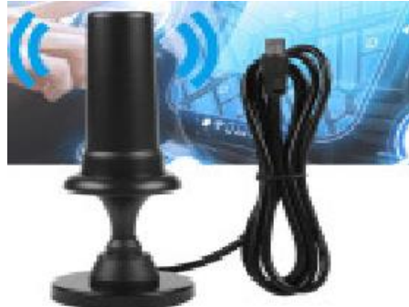
Gb. 1.2 Salah Satu Antena Televisi Mobil

Antena televisi mobil sangat diperlukan untuk baiknya siaran pada 94ias94ise mobil, siaran radio, audio dan video. Siaran yang baik juga perlu kita nikmati atau lihat di mobil melalui pesawat televisi mobil. Untuk mendapatkan siaran yang baik dari pesawat 94ias94ise mobil ini perlu menggunakan antenna dimana sebaiknya adalah antenna luar atau eksternal. Antena eksternal ini akan diletakkan diluar body mobil.