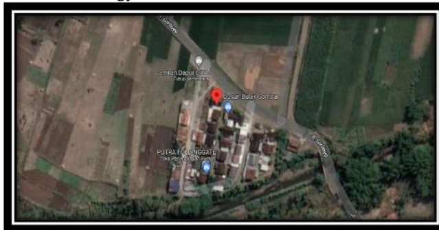
Gambar 2. 1 Lokasi Penelitian

Penelitian ini dilakukan pada Lokasi Relokasi Bulak Gombal di Wukirsari Kecamatan Imogiri Kabupaten Bantul, Daerah Istimewa Yogyakarta.