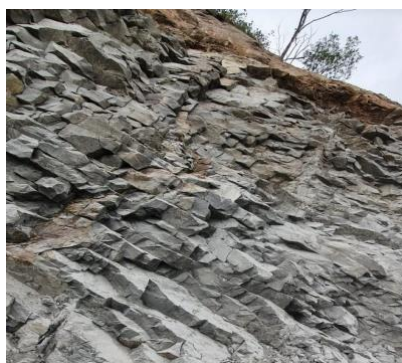
Gambar 1 Kondisi lokasi penelitian

Penelitian ini berlokasi di kawasan Dusun Gunung Rego, Desa Hargorei Kecamatan Kokap, Kabupaten Kulonprogo, Daerah Istimewa Yogyakarta. Penelitian lapangan. Lokasi dari penelitian ditunjukkan oleh gambar berikut.