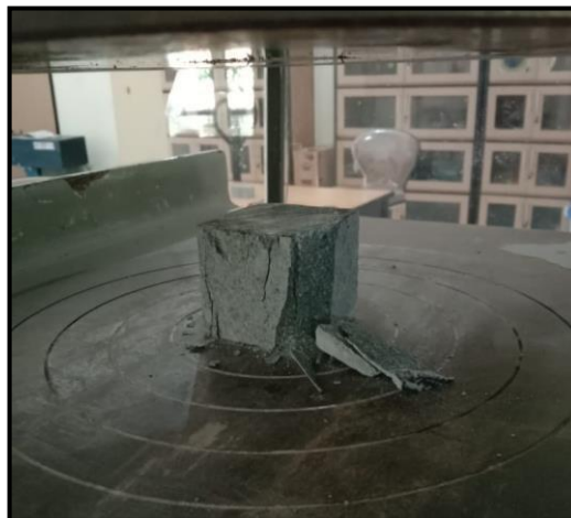
Gambar 4. Pengujian Kuat Tekan Batuan Andesit