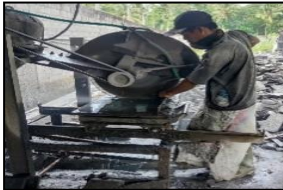
Gambar 2. Proses Pemotongan Sampel Batuan