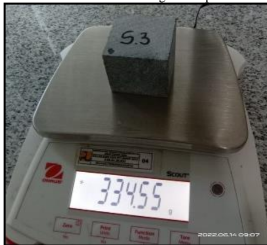
Gambar 3. Penimbangan sampel batuan andesit