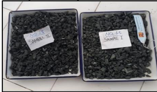
Gambar 6. Pengujian Penyerapan Air

Pengujian ini dimaksudkan untuk mengetahui kemampuan suatu batuan untuk menyerap air.