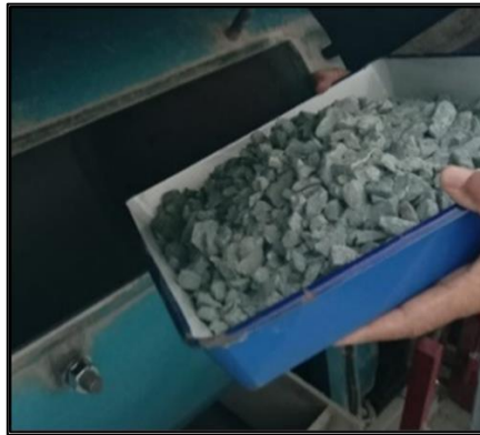
Gambar 5. Pengujian dengan mesin Los Angeles

Pengujian ini bertujuan untuk mengetahui dan menentukan ketahanan suatu agregat terhadap keausan dengan menggunakan mesin los angele.