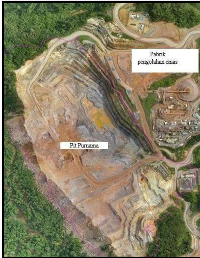
Gambar 1. Lokasi Pit Purnama dan Pabrik Pengolahan Emas

emas dan perak menjadi bentuk bullion (batangan). Sistem penambangan yang digunakan PT. Agincourt Resources adalah sistem tambang terbuka. Penambangan dengan metode open pit dilakukan dari permukaan yang relatif mendatar menuju ke arah bawah dimana endapan bijih berada. Getaran peledakan yang dihasilkan harus berada pada kondisi aman bagi keadaan sekelilingnya. Untuk itu maka perlu dilakukan penelitian untuk mengetahui apakah jumlah bahan peledak yang digunakan menghasilkan getaran yang sesuai dengan standar getaran yang berlaku, yaitu SNI 7571:2010 tentang baku tingkat getaran pada tambang terbuka.