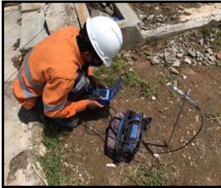
Gambar 2. Pengukuran Getaran di Depan Pabrik Pengolahan

Dari hasil pengukuran yang dilakukan di lapangan mengenai pengaruh jumlah bahan peledak yang digunakan terhadap ground vibration , diperoleh data nilai getaran sebagai berikut: