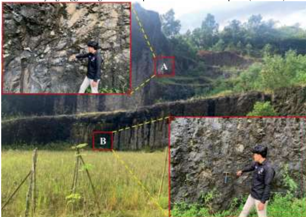
Gambar 5. Lokasi pengambilan sampel fragmen andesit Halang pada lokasi pengamatan 62, (A) bagian atas dan (B) bagian bawah

Berdasarkan data lapangan, dan hasil analisis peta geologi daerah penelitian pada satuan batuan breksi andesit Halang cukup prospek dengan luas penyebaran \pm 25\% dari luas daerah penelitian. Hasil uji tumbukan palu pada fragmen andesit daerah penelitian yang ada di breksi andesit Halang adalah pukulan keras, bergedebuk, terjadi pantulan, sedikit berbekas. Dari uji tumbukan palu dapat diketahui bahwa keenam sampel memiliki kekerasan yang tinggi. Pengambilan sampel dilakukan di Desa Kaliputih. (Gambar 5)