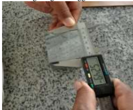
Gambar 3. Pengukuran menggunakan jangka sorong