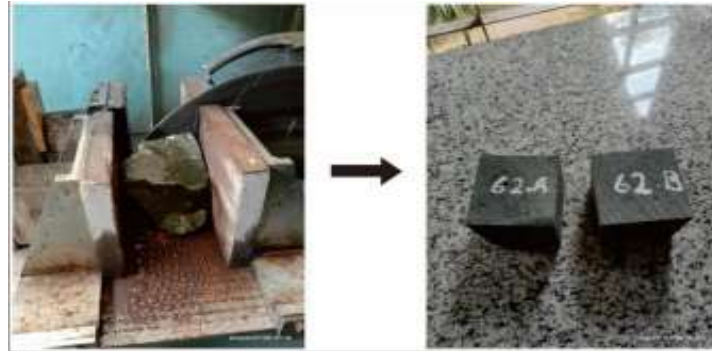
Gambar 2. pengukuran dan pemotongan sampel batuan.

Dalam menganalisa kuat tekan dibagi menjadi dua rangkaian yang perlu diketahui dan dilakukan untuk mendapatkan hasil maksimal, meliputi :