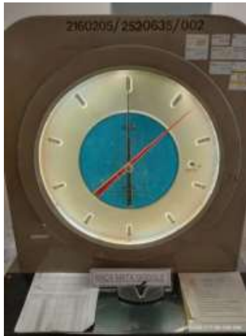
Gambar 4. Mesin PGG alat uji kuat tekan