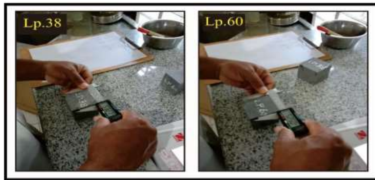
Gambar 1. Pengukuran pada sampel Lp 38 (breksi andesit) dan Lp 60 (lava andesit).