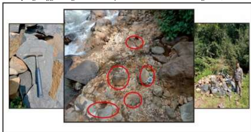
Gambar 3. Singkapan breksi andesit bukti pada Lp 60.

Daerah penelitian yaitu pada Lp 60 berada satuan batuan breksi andesit dan Lp 38 berada pada satuan lava andesit dengan geomorfologi bergelombang kuat-berbukit denudasional (D2). berdasarkan data lapangan, dan hasil analisis peta geologi daerah penelitian pada Satuan breksi andesit, dan lava andesit cukup prospek dengan luas penyebaran \pm % dari luas daerah penelitian. Uji tumbukan palu pada breksi andesit, dan lava andesit daerah penelitian yang ada di daerah Talun, Wates, simper dan Karangasem adalah pukulan keras, bergedebuk, terjadi pantulan, sedikit berbekas. Dari uji tumbukan 9 palu dapat diketahui bahwa dua sampel memiliki kekerasan yang tinggi. Pengambilan sampel dilakukan di Desa Karangasem, Desa Karangdowo talun.