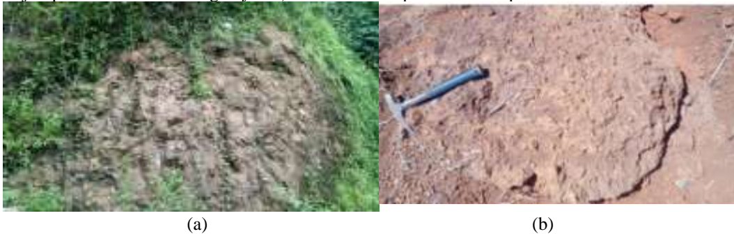
Gambar 1. Perbandingan breksi andesit berdasarkan tingkat pelapukan di daerah penelitian (a) Breksi andesit segar dan (b) Breksi andesit lapuk

Pengujian sifat mekanik breksi andesit pada daerah penelitian dengan menganalisis kuat tekan batuan mengacu pada perbedaan tingkat pelapukan batuan. Adapun nilai kuat tekan yang diamati memiliki perbedaan nilai kuat tekan yang secara signifikan. Hal ini dikarenakan perbedaan tingkat pelapukan yang berbeda yang dijumpai dalam keadaan segar ( fresh ) dan keadaan lapuk di daerah penelitian.