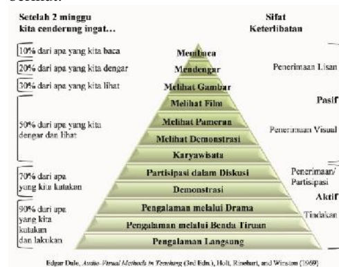
Gambar 3. Kerucut Pengalaman Belajar Edgar Dale

Hal tersebut selaras dengan kerucut pengalaman yang dikemukakan oleh Edgar Dale sebagai berikut: