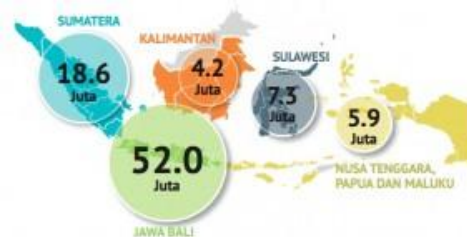
Gambar 1. Persebaran Pengguna Internet di Indonesia

Di Indonesia, berdasarkan data Asosiasi Penyelenggara Jasa Internet Indonesia (APJII), pengguna internet terus mengalami peningkatan dari tahun ke tahun. Dimulai pada tahun 1998 hanya 500.000 orang yang menggunakan Internet, dan pada tahun 2012 pengguna Internet meroket menjadi 63 juta orang. Bahkan PUSKAKOM UI pada bulan April 2015 merilis bahwa jumlah pengguna internet di Indonesia telah mencapai 88,1 juta. Jumlah tersebut apabila dibandingkan dengan jumlah penduduk Indonesia di tahun 2015 sebesar 252,4 juta jiwa maka pengguna internet mencapai 34,9%. Peningkatan yang cukup lumayan dibandingkan tahun 2013 sebelumnya yang baru mencapai 28,6%. Persebaran pengguna internet di wilayah Negara Kesatuan RI dapat dilihat pada gambar 1 sebagai berikut: