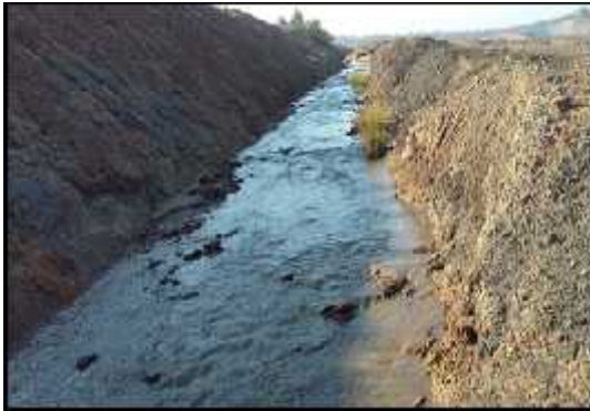
Gambar 4. Saluran Terbuka

Saluran terbuka berfungsi sebagai wadah untuk mengalirkan fluida atau air limpasan yang jatuh ke permukaan tanah menuju ke suatu tempat tertentu. Letak saluran terbuka (Gambar 4) berada di sekitar pit 1 Utara. Saluran terbuka menggunakan penampang bentuk trapesium dengan tipe dinding saluran dari tanah. Dimensi saluran terbuka aktual dan saluran terbuka dari hasil perhitungan dapat dilihat pada Tabel 9.