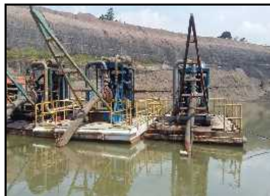
Gambar 3. Pompa Sulzer WPP53-200

Sistem pemompaan aktual di Sump pit 1 Utara adalah sistem paralel dimana dipasang 3 jalur pemompaan. Pompa yang digunakan adalah pompa Sulzer WPP53-200 (Gambar 3), sebanyak 3 unit yang dipasang di sump pit 1 Utara dengan waktu pemompaan 21 jam/hari. Data debit pompa aktual dapat dilihat pada Tabel 4.