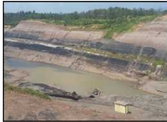
Gambar 2. Sump Pit 1 Utara

dengan volume sebesar 211.560 m 3 . Dimensi sump dapat dilihat pada Tabel 3. Total debit air yang masuk ke dalam sump sebesar 26.604 m 3 /jam, adapun sisa volume air limpasan yang belum terpompa sebesar 46.044,43 m 3 .