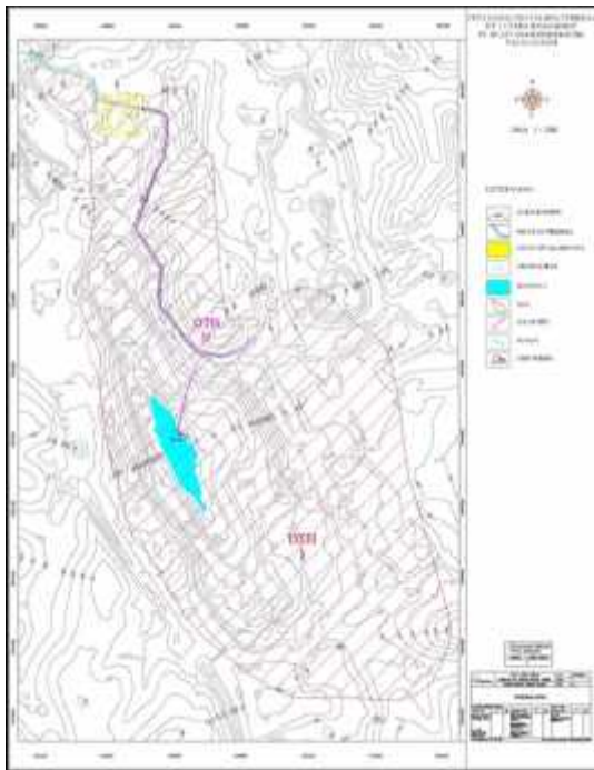
Gambar 1. Peta Daerah Tangkapan Hujan

Pada lokasi penelitian dibagi menjadi 2 (dua) DTH (Gambar 1), dengan nilai koefisien yang bervariasi.