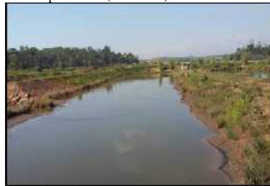
Gambar 6. Kolam Pengendapan

Pembuatan kolam pengendapan bertujuan untuk menampung air dari tambang yang mengandung material (lumpur) sebelum di alirkan ke perairan umum (sungai). Hal ini dilakukan agar patikel-partikel material halus yang tersuspensi di dalam air diendapkan terlebih dahulu sebelum dialirkan ke perairan umum, sehingga nantinya tercipta suatu penambangan yang berwawasan lingkungan. Dimensi Kolam pengendapan berbentuk persegi panjang, dengan memiliki 4 kompartemen yang berkedalaman masing-masing 4 m. Besarnya debit total yang masuk sebesar 0,8317 m 3 /detik sehingga persen solid yang didapatkan yaitu 0,20 %, sedangkan volume dari kolam pengendapan 12.852 m 3 . Salah satu kompartemen kolam pengendapan pit 1 utara dapat dilihat (Gambar 6).