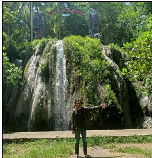
Gambar 2. Air Terjun Goa Kebon

Pada lokasi penelitian memiliki daya tarik wisata air terjun yang tempatnya berada di antara hutan jati, tempat ini masih di jaga kelestariannya sehingga wisatawan akan merasakan hawa sejuk dan gemericik air terjun. Kondisi air lokasi sedang turun hujan cenderung keruh, sedangkan lokasi tidak turun hujan cenderung jernih, sehingga wisatawan dapat bermain air dan juga berenang pada saat yang memungkinkan. Pada lokasi penelitian juga terdapat sarana dan prasarana umum meliputi toilet, tempat duduk, spot foto, tempat parkir, taman bermain.