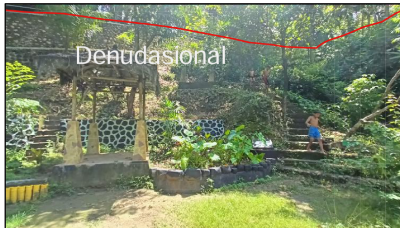
Gambar 4. Bentang Alam Daerah Penelitian

Morfologi daerah penelitian ini mencakup morfometri berupa perbukitan bergelombang sedang dan morfogenesis denudasional [8]. Satuan perbukitan Sentolo ini mempunyai penyebaran yang sempit dan terpotong oleh kali Progo yang memisahkan wilayah Kabupaten Kulon Progo dan Kabupaten Bantul. Ketinggiannya berkisar antara 50 – 150 meter di atas permukaan air laut dengan besar kelereng rata – rata 15 0. Di wilayah ini, satuan perbukitan Sentolo meliputi daerah Kecamatan Pengasih dan Sentolo. Lingkungan pengendapan formasi sentolo dapat dikatakan terbentuk secara bergantian, dimana bagian bawah sentolo yang merupakan satuan breksi terendapkan terlebih dahulu yang merupakan satuan formasi OAF yang kemudian formasi sentolo ikut terendapkan dan tersingkap karena adanya pengangkatan sehingga formasi sentolo merupakan bentukan lahan denudasi.