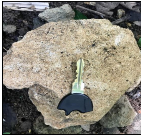
Gambar 3. Litologi Penyusun Daerah Penelitian