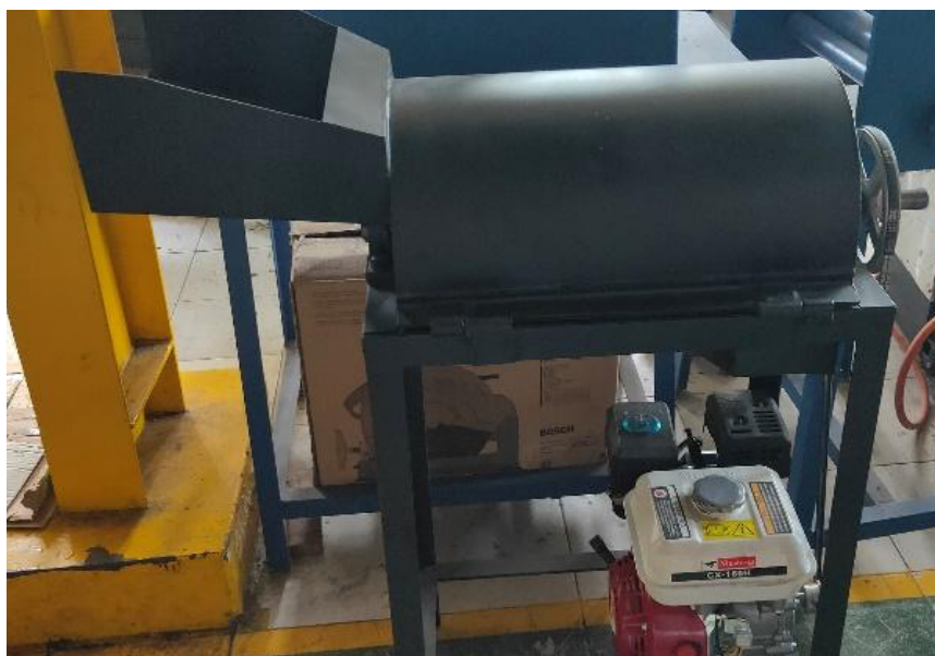
Gambar 2. Mesin pencacah rumput

Cara yang digunakan oleh para petani guna menekan biaya pakan yang semakin mahal, maka petani berinisiatif mencampur pakan utama dengan pakan tambahan. Salah satu caranya adalah dengan mencampur rumput. Sebelum dilakukan proses pencampuran rumput, terlebih dahulu rumput dipotong menjadi bagian kecil terlebih dahulu sebelum dilakukan proses pencampuran. Kemudian rumput dicampur dengan pakan tambahan seperti bekatul, ramuan, sentrat, ketela, ampas tahu, sedikit garam dan diberi air secukupnya. Peternak harus menyediakan hijauan dalam jumlah banyak setiap hari untuk proses pencacahan. Seperti yang ditunjukkan pada Gambar 2., peternak memotong rumput secara manual dan mekanis menggunakan berbagai metode. Kebanyakan petani memotong rumput dengan tangan menggunakan sabit, parang, atau alat pertanian tradisional [3]. Metode manual ini akan membutuhkan lebih banyak waktu dan usaha. Sedangkan cara mekanis membutuhkan waktu lebih cepat dan meminimalkan tenaga kerja [4].