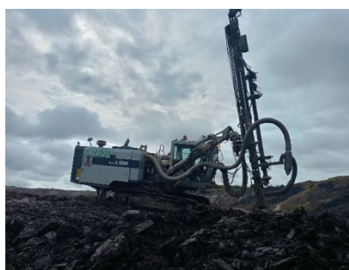
Gambar 2. Furukawa HCR L100

Dilakukannya pemboran menggunakan alat bor berjenis Furukawa HCR L100 dengan diameter bit sebesar 5 inch atau 127 mm. Alat ini memiliki kemampuan dimana untuk Furukawa HCR L100 sendiri bisa menggali lubang bor hingga kedalaman 7 meter sesuai dengan kebutuhan perusahaan dan untuk rata-rata kemampuan perhari pengeboran yang didapat oleh unit ini adalah sedalam 6,6 meter. Pola pemboran yang diterapkan pada lokasi peledakan sendiri adalah Staggered Pattern atau selang-seling, Berikut pada Gambar 2 tampak alat unit bor yang digunakan.