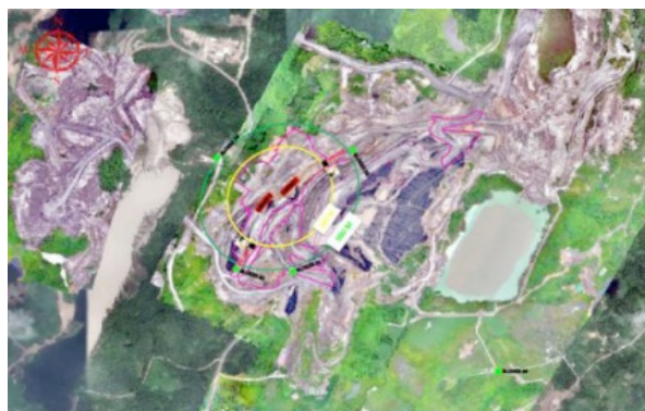
Gambar 1. Foto tampak atas Lokasi Penelitian

Tempat dilakukannya penelitian dan pengamatan melalui kegiatan penambangan, pembongkaran lapisan tanah penutup ( overburden ) yang mana dalam prosesnya dilakukan kegiatan peledakan. Tahapan pada kegiatan penambangan dikerjakan menggunakan sistem tambang terbuka ( open pit ). Metode tambang terbuka merupakan sistem dimana lokasi penambangan ditambang ke arah bawah sehingga membentuk cekungan atau pit. Lokasi yang menjadi tempat kegiatan peledakan di lakukan pada Pit. Pinang A9 dengan susunan lapisannya mulai dari claystone , sandstone , dan siltstone , kondisi tampak atas lokasi penambangan dapat dilihat pada Gambar 1 dengan jarak batas aman manusia 500 meter dan 300 meter untuk alat. Litologi pada daerah penelitian sendiri didominasi oleh banyaknya Sandstone dan Claystone .