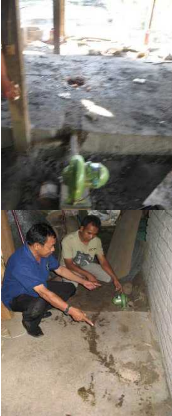
Gambar 2. Realisasi pembuatan tungku di mitra

Meskipun tungku pemanas dengan 1 lubang mempunyai banyak keuntungan meliputi fungsi, waktu dan pembiayaan untuk pembuatan, itu sebenarnya mempunyai banyak kelemahan juga meliputi lingkungan sekitar kotor, cenderung tidak ramah bagi pekerja (pekerja perlu memakai masker) dan kerugian kalor tinggi. Peningkatan efisiensi tungku dengan 1 lubang nyala api dapat ditingkatkan dengan cara memodifikasi volume lubang bahan bakar dan pengaturan debit aliran blower. Untuk pengerjaan