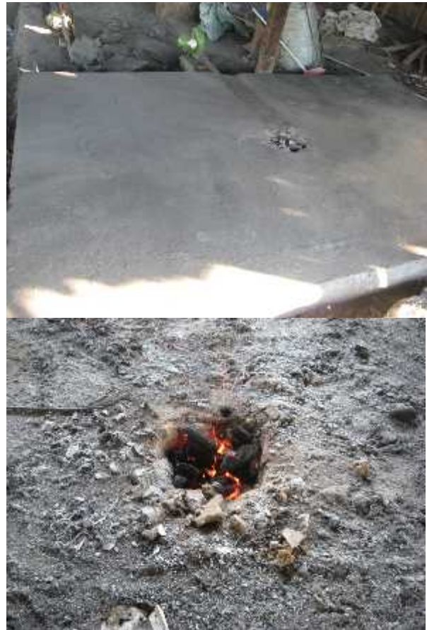
Gambar 3. Revitalisasi tungku bakar.

pemanasan plat relatif kecil, pemilihan volume lubang dapat menggunakan lubang kecil dan pengaturan kecepatan blower pada posisi sedang dan tinggi. Sedangkan untuk pengerjaan pemanasan plat relatif luas dan tebal, pemilihan volume lubang dapat menggunakan lubang besar dan pengaturan kecepatan blower pada posisi rendah dan sedang. Tungku pemanas di mitra di tunjukkan di Gambar 3.