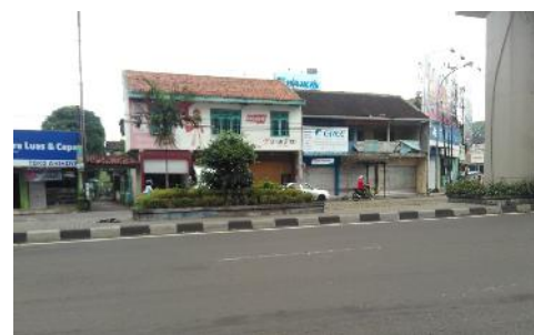
Gambar 5. RTH Bawah Jalan Layang Janti (Observasi Peneliti, 2017)