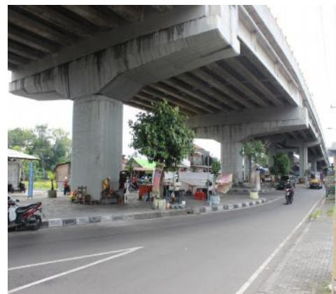
Gambar 4. Dinding Penyangga Jalan Layang Janti (Observasi Peneliti, 2017)

Dinding penyangga jalan layang Janti masih baik dan masih jarang terlihat coretan. Meskipun pedagang dan masyarakat sekitar beraktivitas disitu, namun mereka tetap menjaga kebersihan dinding penyangga jalan layang Janti. Visual dinding penyangga ini sebenarnya bisa menjadi suatu daya tarik apabila dihias dengan gambar-gambar yang khas dari Yogyakarta. Pada segmen awal ruang bawah jalan layang Janti tepatnya pada pertigaan besar Janti masih terlihat ruang terbuka hijau (RTH) dengan sekumpulan vegetasi yang hijau dan ruang yang bersih dari para pedagang kaki lima.