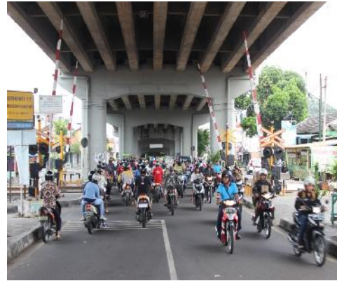
Gambar 3. Perlintasan Kereta Api Kawasan Janti (Observasi Peneliti, 2017)

Dinding penyangga jalan layang Janti masih baik dan masih jarang terlihat coretan. Meskipun pedagang dan masyarakat sekitar beraktivitas disitu, namun mereka tetap menjaga kebersihan dinding penyangga jalan layang Janti. Visual dinding penyangga ini sebenarnya bisa menjadi suatu daya tarik apabila dihias dengan gambar-gambar yang khas dari Yogyakarta. Pada segmen awal ruang bawah jalan layang Janti tepatnya pada pertigaan besar Janti masih terlihat ruang terbuka hijau (RTH) dengan sekumpulan vegetasi yang hijau dan ruang yang bersih dari para pedagang kaki lima.