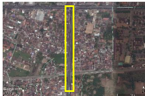
Gambar 1. Lokasi Penelitian

Untuk mengetahui pola pemanfaatan ruang bawah Jalan Layang Janti sebagai ruang publik maka digunakan pendekatan penelitian kualitatif deskriptif. Lokasi penelitian yaitu ruang bawah Jalan Layang Janti yang terletak di Kawasan Janti, Desa Caturtunggal, Kecamatan Depok, Kabupaten Sleman, D. I. Yogyakarta atau Ringroad Timur Kota Yogyakarta