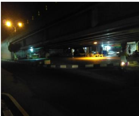
Gambar 7. Penerangan di Malam Hari (Observasi Peneliti, 2017)

Selain pedagang kaki lima, ruang bawah jalan layang juga dimanfaatkan untuk parkir kendaraan. Sebagian besar parkir ditujukan untuk toko-toko di sekitar jalan layang Janti karena keterbatasan ruang pada toko-toko mereka. Sebagian kecil parkir lagi ditujukan untuk para penggemar kuliner di bawah jalan layang Janti. Tidak dipungkiri bila suatu saat kendaraan parkir berlebih dapat menyebabkan hambatan perjalanan kendaraan lalu lalang di bawah jalan layang Janti ini. Kondisi penampilan ruang bawah jalan layang hanya berupa dinding-dinding beton penyangga, belum terdapat beberapa tanaman penghijauan yang bisa menjadikan ruang bawah jalan layang ini menjadi lebih asri dan menarik. Kekurangan dari kondisi eksisting ruang yang ditemui antara lain seperti kurangnya penerangan pada malam hari, peralatan dan gerobak PKL yang ditinggalkan saat tidak digunakan memberi kesan kumuh, masalah sampah dan air bersih karena belum adanya tempat pembuangan dan kran sumber air bersih sehingga dapat mengurangi kualitas produk dagangan yang disajikan, serta lalu lintas yang cukup padat yang dapat mengancam aspek keselamatan pengguna ruang bawah jalan layang apabila tidak hati-hati.