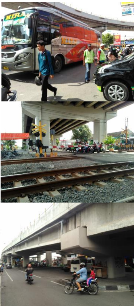
Gambar 10. Mobilitas Kendaraan (Observasi Peneliti, 2017)

Selain dari aktivitas Perdagangan dan Jasa di ruang publik bawah jalan layang Janti juga terdapat aktivitas mobilitas masyarakat. Lokasi kawasan Janti yang strategis ini yang merupakan simpul perbatasan Kabupaten Sleman, Kabupaten Bantul dan Kota Yogyakarta ditunjukkan dengan banyaknya pergerakan masyarakat di kawasan ini. Mobilitas lokal ditunjukkan dengan aktivitas masyarakat menggunakan kendaraan pribadi baik motor maupun mobil serta menggunakan angkutan massal seperti Bus Trans Jogja dan KRL Prambanan Ekspres. Mobilitas antar kota juga ditemui di ruang bawah jalan layang ini seperti pergerakan kendaraan pribadi arah Solo-Yogyakarta, angkutan massal Bus AKAP jurusan Surabaya-Yogyakarta serta Kereta Api Jurusan Surabaya-Yogyakarta.