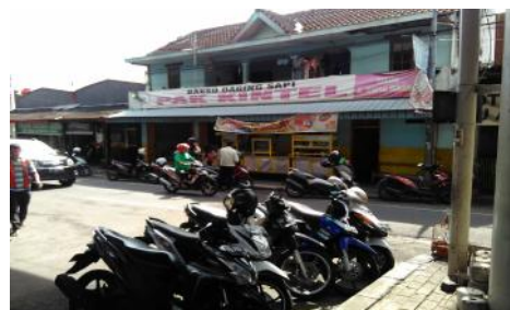
Gambar 9. Perdagangan Sekitar (Observasi Peneliti, 2017)

Selain pedagang kaki lima juga terdapat toko-toko dan warung makan yang ada di kanan dan kiri bawah jalan layang Janti seperti minimarket, toko elektronik, toko aksesoris angkutan udara, warung bakso dan mie ayam, tukang cukur dan tambal ban. Untuk keuntungan yang dirasakan pedagang saat ini cukup memuaskan karena harga jual mereka bisa dua kali harga produksi. Disamping itu, banyak konsumen merupakan mahasiswa yang tentunya meramaikan kawasan ini. Mereka juga tidak perlu membayar biaya sewa untuk berjualan karena ruang bawah jalan layang ini benar-benar kosong dan belum mendapat perhatian dari pemerintah setempat jadi warga masih bebas mengakses ruang ini.