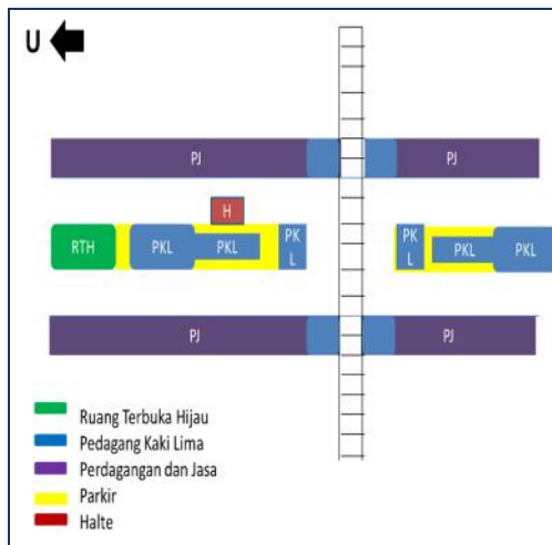
Gambar 12. Pola Pemanfaatan Ruang Publik (Analisis Peneliti, 2017)

sudah penuh, motor-motor bisa parkir naik ke punggung paving blok bawah jalan layang yang masih tersisa di antara para pedagang kaki lima. Parkir mobil diutamakan di badan jalan yang menjorok ke dalam di bawah jalan layang Janti yang terletak di tengah-tengah bawah jalan layang Janti ini. Parkir mobil diarahkan di sebelah barat dan parkir motor di sebelah timur atau naik ke atas paving blok. Lahan parkir bawah jalan layang janti ini juga dimanfaatkan karyawan yang bekerja di kawasan Janti ini karena terbatasnya area parkir depan kantor dan di tengah bawah jalan layang tidak begitu mengganggu jalan umum. Peluang keberadaan parkir ini dimanfaatkan warga sekitar untuk memperoleh penghasilan.