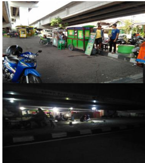
Gambar 8. Aktivitas PKL Malam (Observasi Peneliti, 2017)

Menurut keterangan dari beberapa Pedagang Kaki Lima di bawah jalan layang Janti, mereka yang berjualan di bawah jalan layang Janti ini terus berjualan dari pagi hingga malam hari. Aktivitas pedagang kaki lima sebenarnya relatif sama tiap waktunya hanya berganti jenis dagangannya saja. Satu pedagang bisa berjualan dari pagi hingga malam hanya dengan mengganti barang dagangannya.