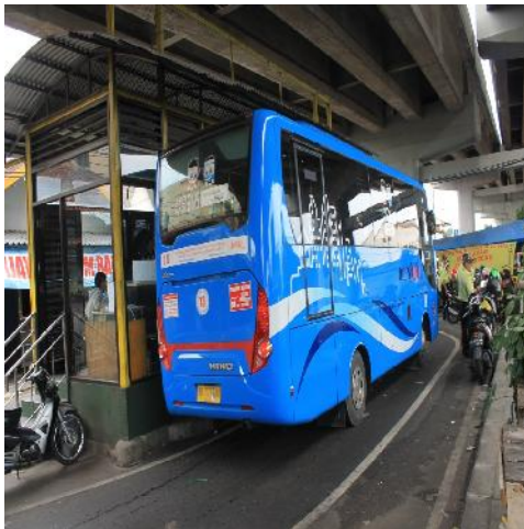
Gambar 2. Halte Bus Trans Jogja Janti Selatan (Observasi Peneliti, 2017)

Kondisi ruang bawah jalan layang Janti secara fisik masih baik, kokoh dan kuat. Ruang bawah jalan layang Janti saat ini dimanfaatkan untuk pedagang kaki lima dan parkir kendaraan. Kondisi ruang bawah jalan layang Janti agak kotor dengan adanya gerobak-gerobak pedagang yang ditinggalkan jika saat tidak berjualan. Penerangan ruang bawah jalan layang Janti masih gelap hanya cahaya penerangan dari rumah dan toko di sekitar area jalan layang Janti. Di bawah jalan layang Janti ini terdapat Halte Bus Trans Jogja dan rel kereta api jurusan Jogja-Surabaya. Hal ini menunjukkan bahwa padatnya arus lalu lintas Janti menjadi potensi banyaknya mobilitas penduduk yang singgah di area Janti ini.