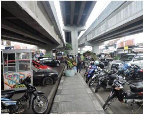
Gambar 6. Parkir Bawah Jalan Layang Janti (Observasi Peneliti, 2017)

Selain pedagang kaki lima, ruang bawah jalan layang juga dimanfaatkan untuk parkir kendaraan. Sebagian besar parkir ditujukan untuk toko-toko di sekitar jalan layang Janti karena keterbatasan ruang pada toko-toko mereka. Sebagian kecil parkir lagi ditujukan untuk para penggemar kuliner di bawah jalan layang Janti. Tidak dipungkiri bila suatu saat kendaraan parkir berlebih dapat menyebabkan hambatan perjalanan kendaraan lalu lalang di bawah jalan layang Janti ini. Kondisi penampilan ruang bawah jalan layang hanya berupa dinding-dinding beton penyangga, belum terdapat beberapa tanaman penghijauan yang bisa menjadikan ruang bawah jalan layang ini menjadi lebih asri dan menarik. Kekurangan dari kondisi eksisting ruang yang ditemui antara lain seperti kurangnya penerangan pada malam hari, peralatan dan gerobak PKL yang ditinggalkan saat tidak digunakan memberi kesan kumuh, masalah sampah dan air bersih karena belum adanya tempat pembuangan dan kran sumber air bersih sehingga dapat mengurangi kualitas produk dagangan yang disajikan, serta lalu lintas yang cukup padat yang dapat mengancam aspek keselamatan pengguna ruang bawah jalan layang apabila tidak hati-hati.