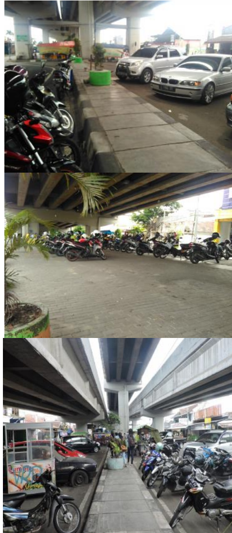
Gambar 11. Parkir Kendaraan (Observasi Peneliti, 2017)

layang Janti menjelaskan bahwa keuntungan mereka didukung dengan kehadiran mahasiswa karena beberapa kampus terdapat di sekitar kawasan Janti ini, serta kehadiran para pekerja yang keluar masuk Jogja memilih kawasan Janti ini untuk transit sembari mereka beristirahat di tengah perjalanan mereka berangkat atau pulang kerja. Beberapa pengunjung dari luar provinsi juga turun transit menikmati makan minum di bawah Jalan Layang Janti ini sambil menunggu jemputan atau hanya sekedar beristirahat untuk meneruskan perjalanan ke dalam Kota Yogyakarta.