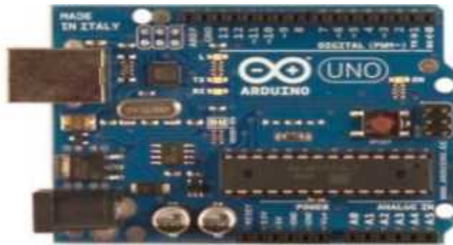
Gambar 2. Hardware Papan Arduino Uno

Mikrokontroler yang digunakan pada penelitian ini ialah mikrokontroler Arduino UNO yang telah terpasang Atmega 328 dalam board. Arduino Uno memiliki 14 pin digital (6 pin dapat digunakan sebagai output PWM (Pulse Width Modulator)). Tampak atas dari arduino uno dapat dilihat pada Gambar 6.