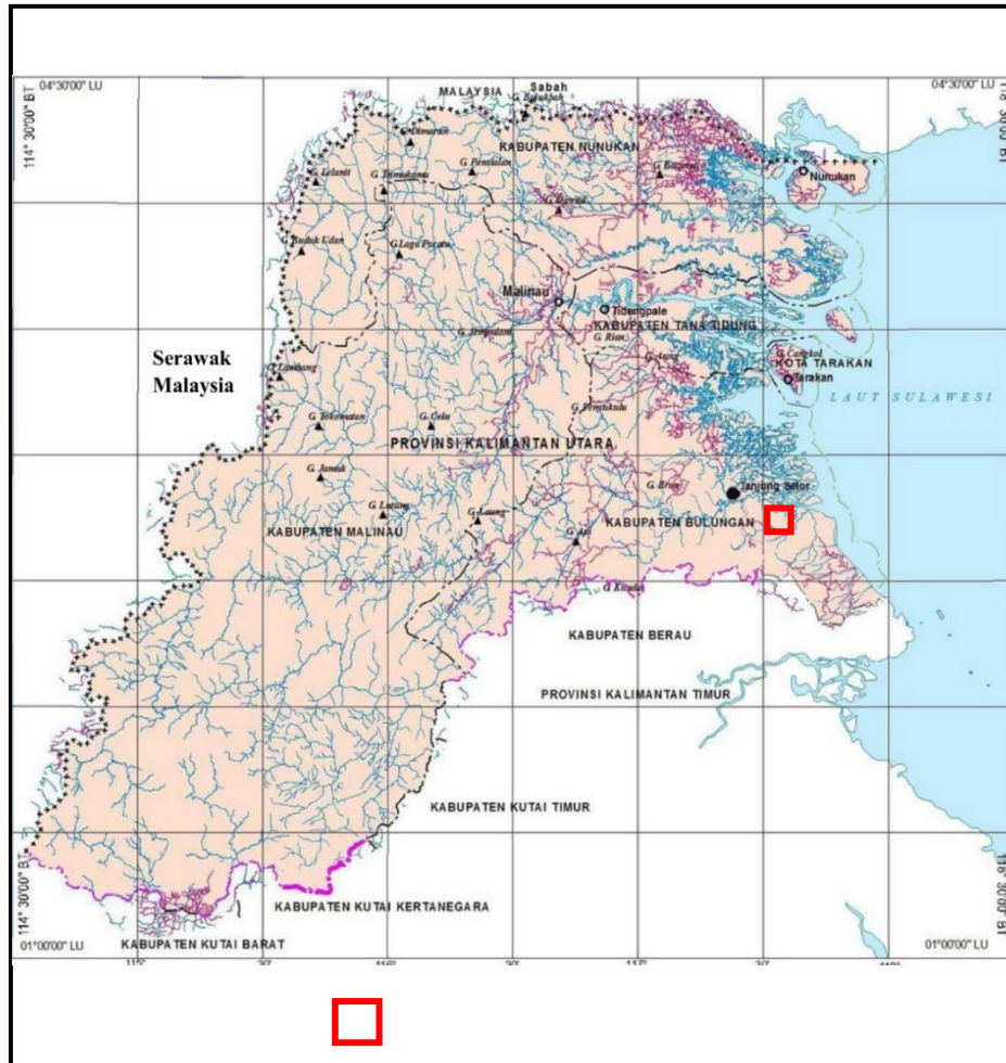
Gambar 1. Lokasi daerah penelitian berada di Kabupaten Bulungan, Provinsi Kalimantan Utara [1] dan [2]

Badan Geologi Kementerian Energi dan Sumber Daya Mineral (ESDM), cadangan batubara Indonesia mencapai 26,2 miliar ton. Cadangan tersebut sebagian besar berada di Kalimantan dan Sumatera Selatan.