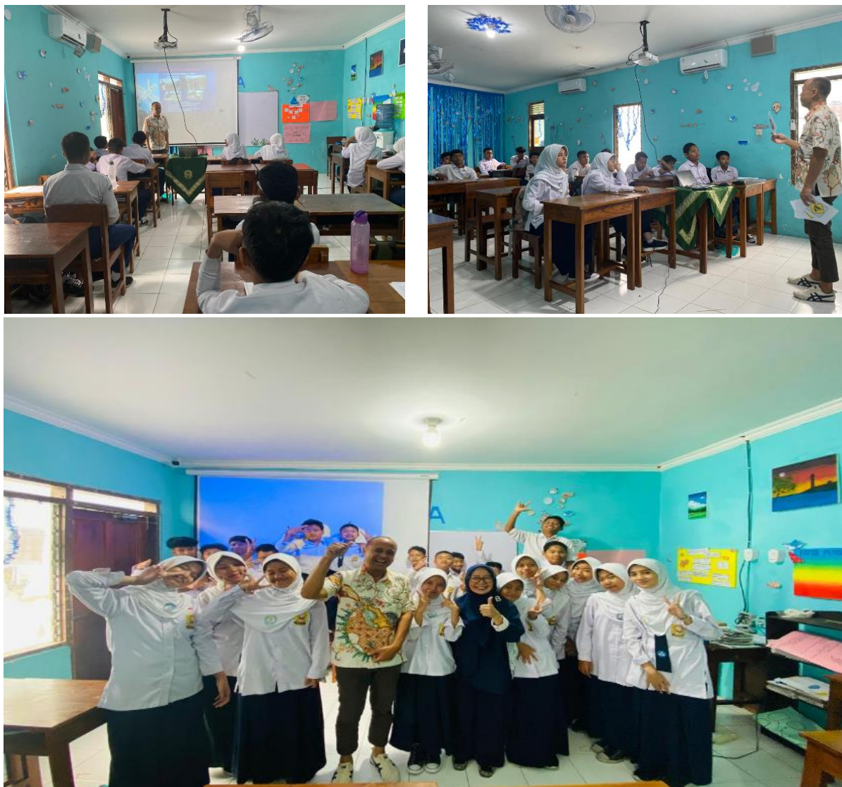
Gambar 3. Pelaksanaan Sosialisasi