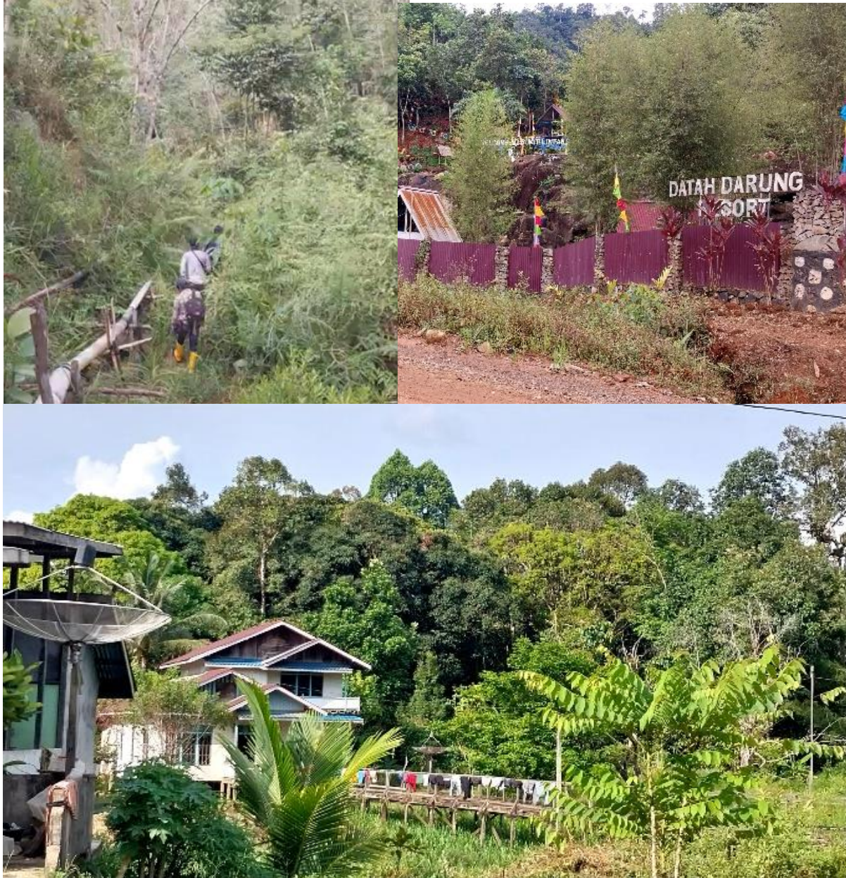
Gambar 1. Kategori Penggunaan Lahan di Desa Manggala

Untuk memahami dinamika spasial di Desa Manggala, analisis dilakukan terhadap komposisi dan perubahan penggunaan lahan pada periode 2020–2025. Penggunaan lahan di Desa Manggala terdiri dari 6 kategori, meliputi sungai, permukiman, lahan kosong, hutan, semak, dan ladang (Gambar 1). Identifikasi kategori lahan ini penting karena memberikan gambaran mengenai kondisi awal wilayah sekaligus arah perubahan yang terjadi, sehingga dapat dijadikan dasar dalam mengevaluasi dampak pembangunan terhadap lingkungan dan tata ruang desa.