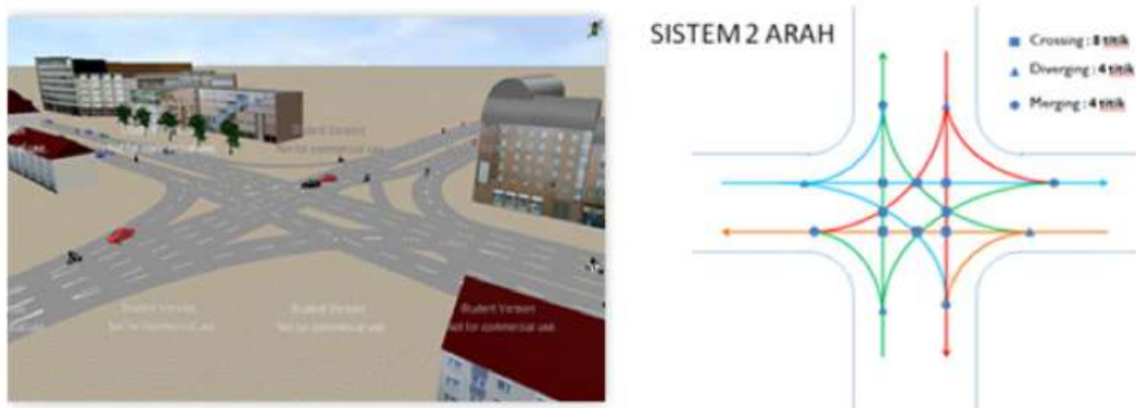
Gambar 4. Tipikal konflik pada persimpangan sebidang di Daerah Perkotaan

Aplikasi Struktur Baja Bergelombang dapat digunakan untuk mengurai permasalahan kemacetan pada simpang sebidang di daerah perkotaan, pada perlintasan kereta api, dan pada proteksi untuk longoran lereng jalan. Tipikal konflik pada persimpangan sebidang di Daerah Perkotaan dapat dilihat pada Gambar 4, tipikal penanganan dengan jalan lintas atas dapat dilihat pada Gambar 5, sedangkan Gambar 6 menyajikan Konsep Aplikasi Struktur Baja Bergelombang untuk Jalan Lintas Atas. Contoh aplikasi struktur baja bergelombang di Indonesia dapat dilihat pada Gambar 7.