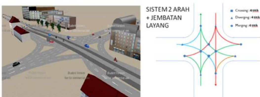
Gambar 5. Tipikal penanganan dengan jalan lintas atas