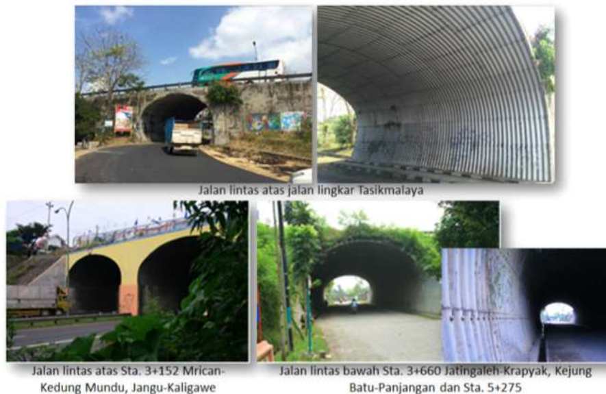
Gambar 7. Aplikasi Struktur Baja Bergelombang di Indonesia