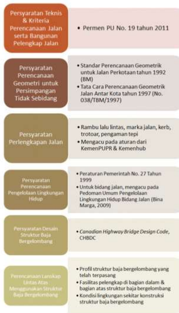
Gambar 8. Perencanaan Teknologi Corrugated-Mortar Pusjatan [2], [3]