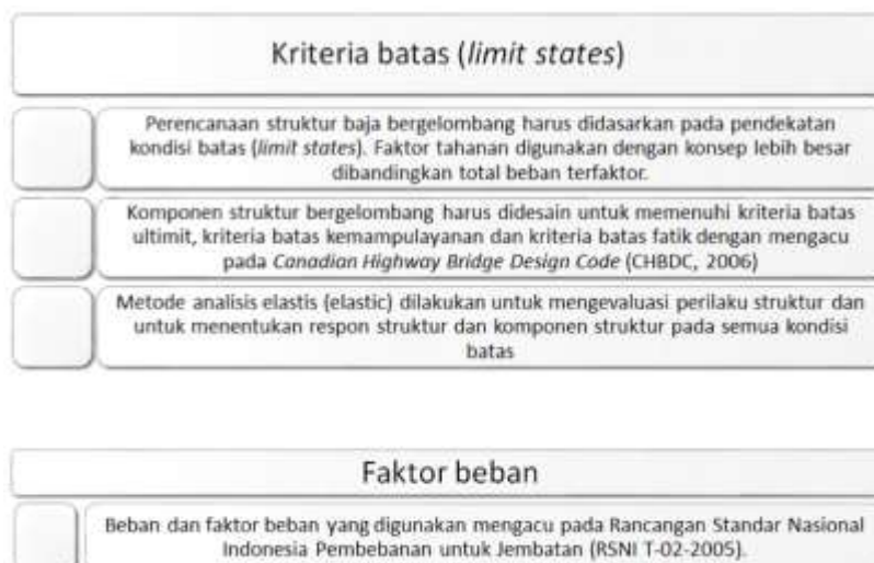
Gambar 9. Persyaratan Desain Struktur Baja Bergelombang