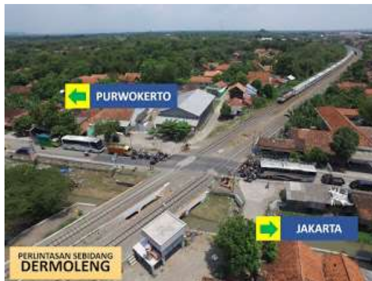
Gambar 2. Perlintasan sebidang Dermoleng sebelum Fly Over Dermoleng dibangun

Kondisi perlintasan sebidang Ruas Dermoleng sebelum Fly Over Dermoleng dibangun dapat dilihat pada Gambar 2, sedangkan Ruas Dermoleng setelah konstruksi Fly Over Dermoleng selesai dapat dilihat pada Gambar 3