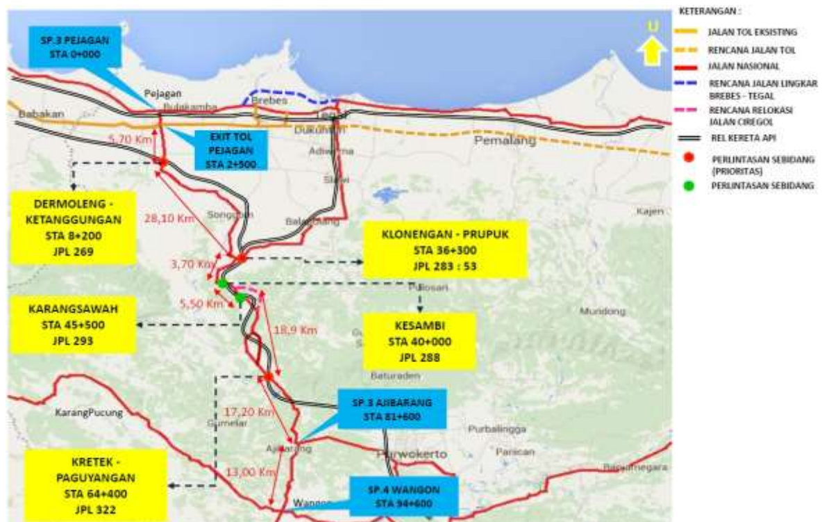
Gambar 1. Lokasi Fly Over Dermoleng

Studi kasus pada penelitian ini pada ruas jalan nasional di Kabupaten Brebes, khususnya Perlintasan Kereta Api di Dermoleng, Ketanggungan, seperti terlihat pada Gambar 1. Konstruksi Fly Over Dermoleng dengan panjang 650 meter dilaksanakan oleh PT. Adhi Karya (Persero), Tbk-CDI (KSO) dengan nilai investasi Rp 64 Milyar. Pembangunan Fly Over Dermoleng dimulai pada bulan November 2016 dan beroperasi pada bulan Juni 2017.