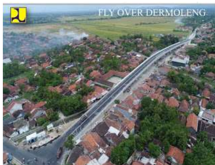
Gambar 3. Perlintasan sebidang Dermoleng setelah konstruksi Fly Over Dermoleng selesai dibangun