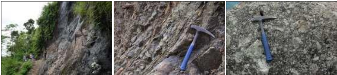
Gambar 5. Fasies pusat gunung api ditunjukkan oleh batuan intrusi diorit mikro sebagai cryptodome atau volcanic neck (kiri); lava andesit (tengah); dan aglomerat (kanan) (LP 6).

G. Ijo mempunyai bukaan (kawah) berdimensi sangat luas dengan diameter yang diperkirakan mencapai 2000 m. Bagian dalam bukaan G. Ijo tersebut disusun oleh litologi yang mempunyai kriteria batuan intrusi, cryptodome (intrusi dangkal yang terletak di bawah kubah lava), aliran lava yang membentuk struktur kekar lembaran, dan aglomerat (Gambar 5).