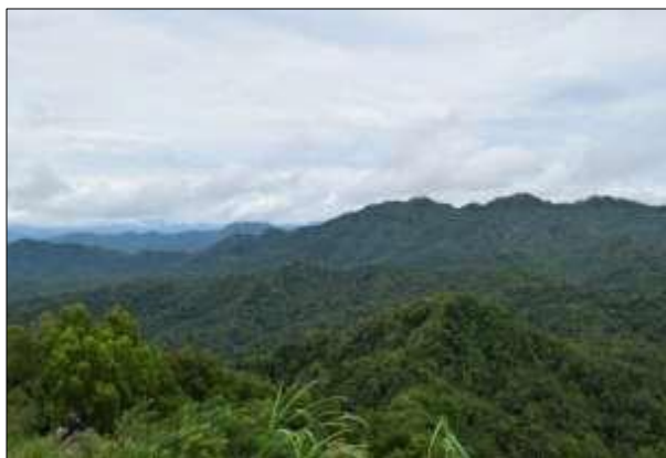
Gambar 3. Bentang alam G. Ijo dan sekitarnya, dicirikan relief kasar yang terdapat di dalam gawir yang melingkar (foto diambil dari puncak G. Ijo).

Bentang alam G. Ijo dan sekitarnya pada umumnya memperlihatkan relief kasar, dan melandai ke arah barat daya membentuk gawir terjal yang menghadap ke arah timur laut (Gambar 3). Gawir tersebut melingkupi bukit berbentuk kubah yang sedikit memanjang ke arah utara berupa tubuh intrusi, lava atau breksi autoklastika. Bentang alam ini merupakan bagian hulu atau daerah tangkapan air dari aliran – aliran sungai yang mengalir pada daerah penelitian yang akhirnya bermuara di Waduk Sermo atau Kokap. Pola pengaliran yang berkembang di satuan bentang alam ini adalah memusat pada bentuk cekungan waduk, sedangkan yang berkembang di belakang gawir yang melingkupi waduk berupa pola pengaliran relatif radier atau memancar menjauhi waduk. Waduk merupakan budaya manusia yaitu berupa bangunan dam atau bendungan untuk menampung air yang berasal dari banyak sungai berbagai arah dan menyatu di waduk tersebut.