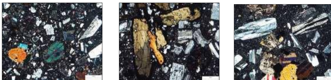
Gambar 4. Kenampakan petrografi batuan. Kiri: andesit – basal porfiri; tengah: andesit porfiri ; kanan: andesit piroksen.

Stratigrafi daerah penelitian tersusun oleh Formasi Sentolo, Kompleks Vulkanik Progo, endapan aluvial dan endapan produk G. Merapi. Secara umum, batuan gunung api yang dijumpai menunjukkan karakter batuan penyusun relatif seragam yang terdiri atas batuan beku dengan tekstur afanit – porfiroafanitik hipokristalin sampai bertekstur mikrokristalin. Batuan penyusun tersebut ekuivalen dengan batuan penyusun Formasi Andesit Tua yang diketahui sebagai kelompok batuan yang menerobos Formasi Nanggulan. Selain itu, tersingkap batuan karbonat yang mewakili Formasi Sentolo di bagian tenggara daerah penelitian.