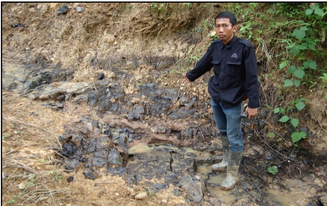
Gambar 4. Seam B1 batubara di Desa Tanjung Belit.

Singkapan seam B1 berada di bagian tengara pada daerah telitian, singkapan berada tubuh sungai, lapisan batubara pada lokasi pengamatan ini mempunyai kedudukan lapisan batuan N 305^{\circ}E/15^{\circ} . Batubara, batuan sedimen organik, hitam, kilap cerah, gores: coklat kehitaman, brittle, pecahan: kotak tidak beraturan. Dan tebal 1.7 m. Lapisan bagian atas batubara ( roof ) dan lapisan bagian bawah batubara ( floor ). Lapisan bagian atas batubara ( roof ) berupa soil berwarna coklat, dengan ketebalan lebih dari 1 m (meter) dan Lapisan bagian bawah batubara ( floor ) berupa batu lempung karbon, berwarna hitam, dengan ketebalan lebih dari 0.75 m (meter).