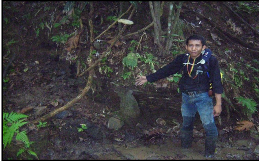
Gambar 5. Seam B2 batubara di Desa Tanjung Belit.

Pengamatan singkapan seam B2 yang dilakukan pada singkapan batubara, berada di bagian barat laut pada daerah telitian, singkapan berada tebing, lapisan batubara pada lokasi pengamatan ini mempunyai kedudukan lapisan batuan N 300°E/11°. Batubara, batuan sedimen organik, hitam, kilap cerah, gores: coklat kehitaman, brittle, pecahan: kotak tidak beraturan. Dan tebal 1.04 m. Lapisan bagian atas batubara ( roof ) dan lapisan bagian bawah batubara ( floor ). Lapisan bagian atas batubara ( roof ) berupa batulempung berwarna abu-abu, dengan ketebalan lebih dari 0.6 m (meter) dan Lapisan bagian bawah batubara ( floor ) berupa batu lempung karbon, berwarna hitam, dengan ketebalan lebih dari 0.53 m (meter).