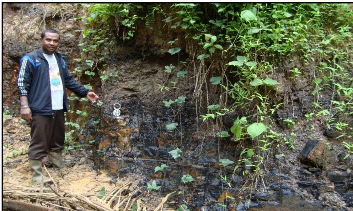
Gambar 2. Seam A1 batubara di Desa Tanjung Belit.

Pengamatan singkapan yang dilakukan pada singkapan batubara, berada di bagian barat laut pada daerah telitian, singkapan berada ditepi lereng bukit, lapisan batubara pada lokasi pengamatan ini mempunyai kedudukan seam A1 batuan N 315°E/12°. Batubara, batuan sedimen organik, hitam, kilap cerah, gores: kehitaman, brittle, pecahan: conchoidal, terdapat amber. Dan tebal 1.8 m. Lapisan bagian atas batubara ( roof ) dan lapisan bagian bawah batubara ( floor ). Lapisan bagian atas batubara ( roof ) berupa batulempung berwarna coklat, dengan ketebalan lebih dari 0.8 m (meter) dan Lapisan bagian bawah batubara ( floor ) berupa batulempung berwarna coklat keabu-abuan, dengan ketebalan lebih dari 1,1 m (meter), jadi lapisan pengapit atau pembawa batubara yaitu batulempung.