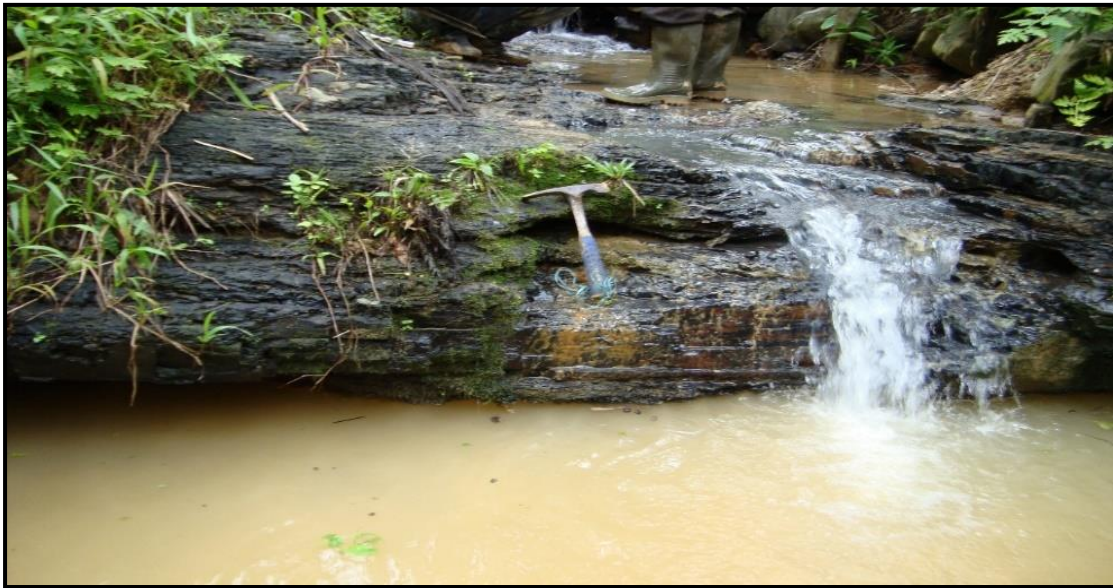
Gambar 3. Seam A2 batubara di Desa Tanjung Belit.