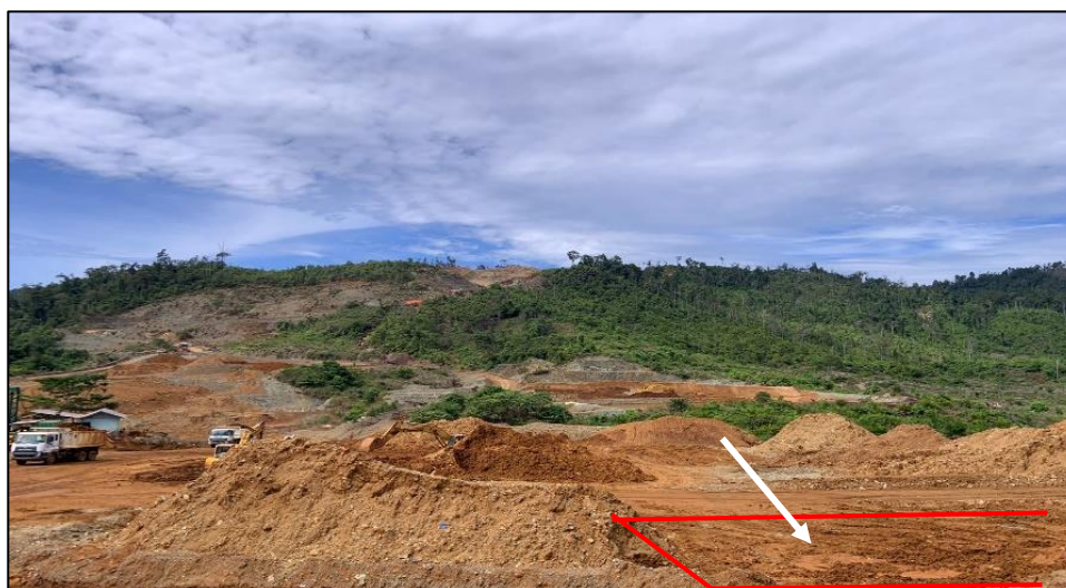
Gambar 4. Lapisan Bedding Stockyard Transit

Hal ini dikarenakan pada saat dilakukannya penelitian di PT. Bukit Makmur Istindo Nikeltama terdapat beberapa operator yang ternyata kurang ahli ataupun handa dalam melakukan pemilahan bijih nikel sesuai dengan kadar yang sudah ditentukan oleh perusahaan, sering kali ditemukan dalam melakukan ore cleaning , dimana sering kali operator tersebut melewati batas kedalaman yang telah ditentukan sehingga menyebabkan bijih nikel banyak tercampur dengan material pengotor atau bijih nikel kadar rendah (LSGO). Kemampuan operator sangat mempengaruhi besar kecil bijih nikel yang hilang akibat proses ore cleaning . Operator harus bisa membedakan antara yang mana lapisan bedding bijih nikel pada stockyard transit dan stockyard final ore .