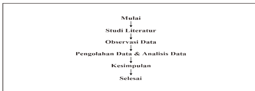
Gambar 1. Metode penelitian

Berdasarkan penjelasan diatas, metode penelitian secara ringkas dapat dilihat pada Gambar 1.