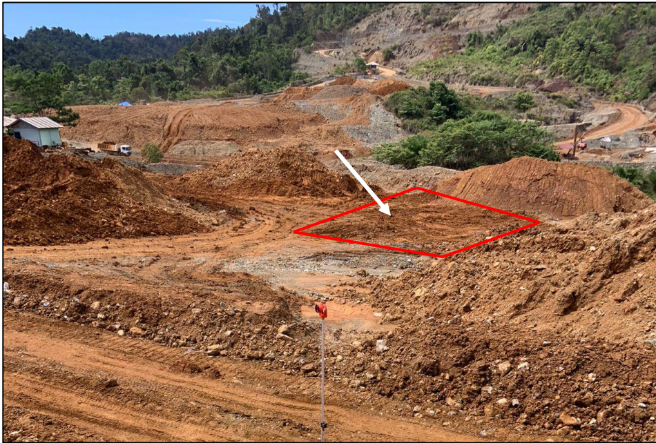
Gambar 5. Bijih nikel tidak terbawa di area stockyard transit

Dapat dilihat pada Gambar 6 terlihat kondisi stockyard final ore di PT. Bukit Makmur Istindo Nikeltama memiliki sistem drainase yang tidak berjalan dengan baik. Apabila terjadi hujan, tidak semua air mengalir ke paritan, ada yang membentuk genangan di beberapa titik dumping bijih nikel pada stockyard final ore . Pada proses pemuatan bijih nikel sering kali operator melebihi kapasitas vessel dumptruck yang ada, sehingga bijih nikel yang dimuat terjatuh dan keluar masuk nya alat berat dan alat angkut yang akan memuat bijih nikel. Beberapa hal ini yang mengindikasikan terjadinya kehilangan bijih nikel tergerus oleh ban alat angkut yang menyebabkan terbentuknya bijih nikel ukuran halus.