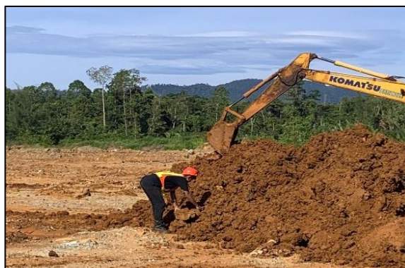
Gambar 2. Pengambilan sample re-check

Penelitian ini melakukan analisis penyebab faktor kehilangan bijih nikel dan melakukan pengamatan lapangan yang didasari oleh faktor potensi kehilangan bijih nikel yang dikemukakan Mardiono [3], dimana dilakukan perbandingan antara factor penyebab menurut teori dengan keadaan langsung dilapangan. Berdasarkan data hasil penelitian dilapangan dan analisis yang dilakukan di PT. Bukit Makmur Istindo Nikeltama terdapat banyak bijih nikel yang digunakan sebagai bedding basement stockyard transitio , stockyard final ore serta kehilangan ( losses ) juga disebabkan pengambilan sample re-check untuk dilakukannya analisis kadar bijih nikel tersebut untuk dibawa menuju laboratorium analisis Quality Assurance dan Quality Control . Dari Gambar 2. dapat dilihat terdapat pengambilan sample re-check oleh pihak quality assurance dan quality control pengambilan sample dilakukan per-ritase dumptruck . Banyaknya sample yang diambil pada kegiatan sample re-check ini juga menyebabkan terjadinya kehilangan ( losses ) bijih nikel semakin meningkat.