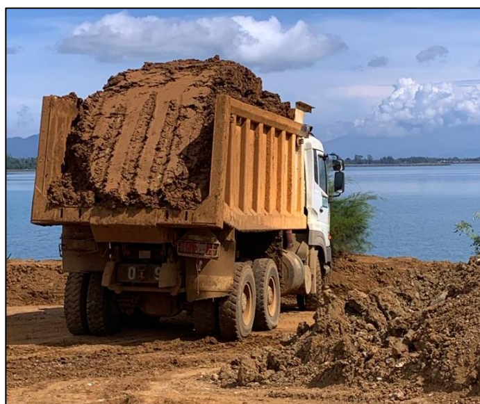
Gambar 8. Dumptruck yang tidak memiliki penutup

Pada saat penelitian dilakukan, kegiatan pengangkutan ( hauling ) bijih nikel, beberapa driver dumptruck mengemudi dengan tidak baik. Hal ini dikarenakan driver tersebut ingin mencapai target ritase dengan cepat pada kegiatan blending bijih nikel. Selain hal tersebut dumptruck tidak memiliki penutup vessel sehingga memungkinkan untuk terjadinya kehilangan ( losses ) terjatuhnya material. Pada Gambar 8 dapat kita lihat, mengakibatkan bijih nikel tercecer di sepanjang jalan hauling .