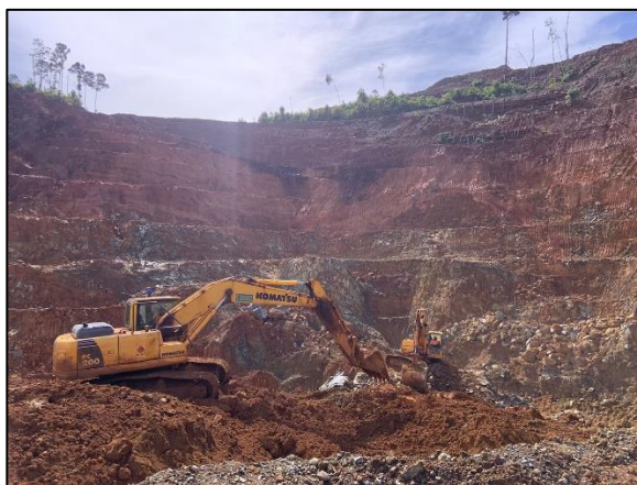
Gambar 3. Proses sidecast ore nickel .

Proses Kehilangan ( losses ) bijih nikel pada kegiatan pembersihan bijih nikel pada lantai ataupun lapisan bedding ini sangat sulit dihindari dikarenakan untuk mencapai kualitas bijih nikel sesuai yang ditetapkan harus dilakukan pembersihan dengan baik [3]. Proses pembersihan bijih nikel atau pemilahan bijih nikel yang sangat bersih dapat mempengaruhi ore recovery dikarenakan semakin banyak bijih nikel yang tercampur material pengotor akibat proses pembersihan bijih nikel pada lapisan bedding maupun ore getting , semakin sedikit bijih nikel yang akan tertambang. Keahlian seorang pengawas berperan penting untuk menghasilkan hasil yang maksimal dan juga berkualitas dari kadar bijih nikel tersebut, Seorang pengawas wajib memiliki skill pengawasan terhadap operator untuk meminimalisir kehilangan ( losses ) bijih nikel.