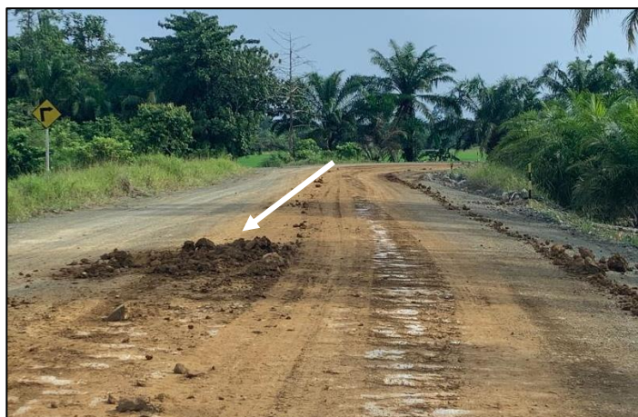
Gambar 7. Bijih nikel yang terjatuh di jalan pengangkutan

Pada saat penelitian dilakukan, kegiatan pengangkutan ( hauling ) bijih nikel, beberapa driver dumptruck mengemudi dengan tidak baik. Hal ini dikarenakan driver tersebut ingin mencapai target ritase dengan cepat pada kegiatan blending bijih nikel. Selain hal tersebut dumptruck tidak memiliki penutup vessel sehingga memungkinkan untuk terjadinya kehilangan ( losses ) terjatuhnya material. Pada Gambar 8 dapat kita lihat, mengakibatkan bijih nikel tercecer di sepanjang jalan hauling .