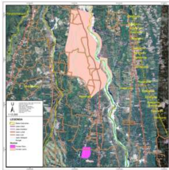
Peta hunian lama dan hunian baru Padukuihan Jambu Gambar 4. Lokasi Padukuihan Jambu lama dan lokasi Padukuihan Jambu baru (Huntap Batur) (Sumber: Survey dan Olahan , 2021)

Permukiman Padukuihan Jambu di relokasi di lokasi baru di Huntap Batur (masih di KRB III), permukiman baru lebih tertata lingkungannya daripada permukiman lama, diantaranya terdapat: