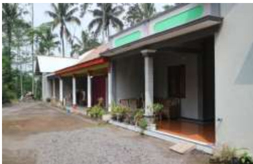
Hunian baru Padukuhan Jambu (Huntap Batur)