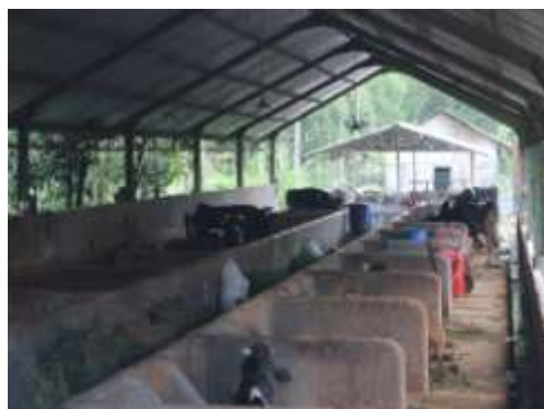
Lahan Perternakan dan Kandang Kelompok di KRB III (aman)