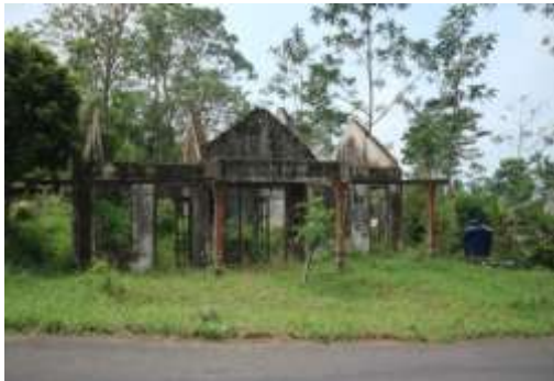
Hunian lama Padukuhan Jambu