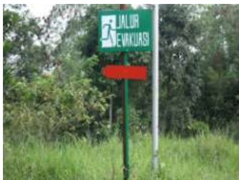
Papan Petunjuk Jalur Evakuasi