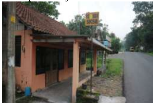
POS Induk SKSB Pengamatan Gunung Merapi