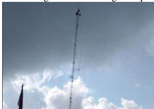
Sirine Tanda Bahaya Gunung Merapi