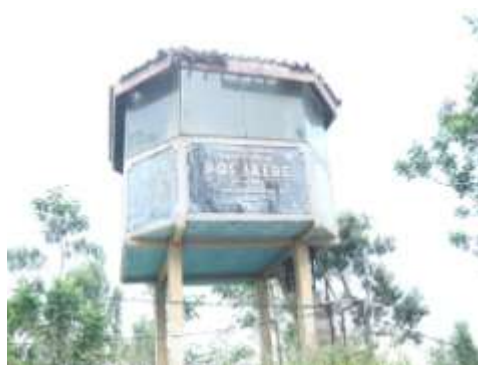
Pos Pengamatan Gunung Merapi