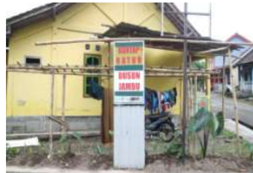
Hunian baru Padukuhan Jambu (Huntap Batur)