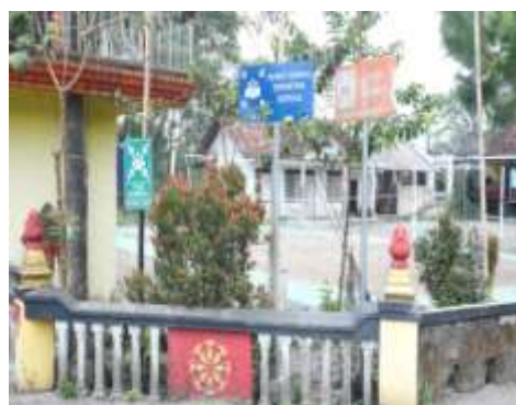
Titik Kumpul Evakuasi Desa Kepuharjo dan sekitarnya