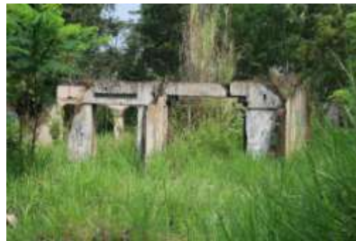
Hunian lama Padukuhan Jambu