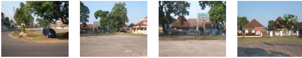
Gambar 4. Lapangan sebagai pusat aktivitas warga