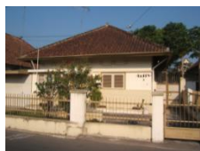
Rumah tipe Sedang

1. Penataan Ruang Kawasan Kampung Kwarasan; Dari pola tata ruang yang telah dilakukan Karsten dapat dilihat bahwa pola penataan ruang Kampung Kwarasan Magelang tidak mengubah kontur di kawasan tersebut. Dalam perencanaannya Thomas Karsten justru memberikan penguatan pada kondisi eksisting tapak untuk kepentingan penghuninya. Meskipun terbagi menjadi 3 (tiga) zonasi akan tetapi semua kelompok bangunan tersebut menyatu dalam satu kawasan tanpa adanya pembatas. Pola penataan ruang tersebut didasarkan pada letak bangunan dan orientasi bangunan terhadap lingkungan sekitar serta berdasarkan kondisi tapak yang ada yaitu dari tapak yang tinggi di sebelah Timur dan semakin menurun serta mendatar di sebelah Barat. Tapak tertinggi di sebelah Timur diperuntukkan bagi bangunan tipe besar yang dapat mengakses ke segala arah, baik itu pandangan (view), dekat dengan pusat kawasan (lapangan) maupun pencapaian melalui jalan besar. Semakin ke timur tapak menjadi datar diperuntukkan bagi bangunan tipe kecil yang tetap memiliki pemandangan ke Barat (ke arah gunung dan sungai) akan tetapi akses pencapaian yang melalui jalan kecil (gang) dan jauh dari pusat kawasan (lapangan).