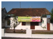
Rumah tipe Kecil