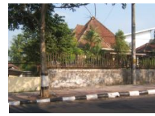
Rumah tipe Besar