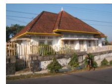
Rumah tipe Besar